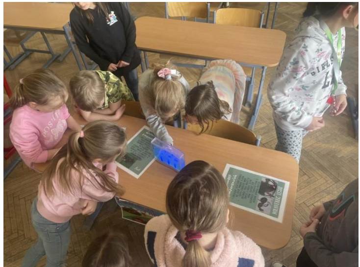
Vypracovala: Vychovatelka ŠK Pavlovská Lucie